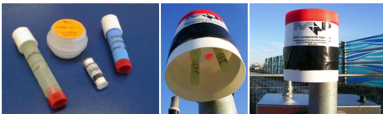
figuur 4 Passieve meetmonsters voor o.a. NO 2

Naast continue meetapparatuur, waarbij de concentraties continue (dat wil zeggen elke paar minuten) bepaald worden, is het mogelijk om allerlei gassen via passieve methoden te meten. Het voordeel van passieve metingen is dat ze relatief goedkoop zijn en (daardoor) op veel verschillende posities gelijktijdig uitgevoerd kunnen worden. Een nadeel is dat het resultaat gemiddelde concentraties oplevert over een langere periode, bijvoorbeeld twee weken.