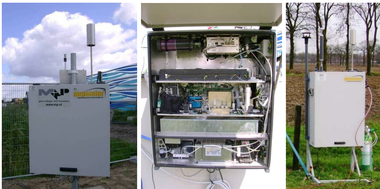
figuur 3 NOx-meetapparatuur: Airpointer

Een foto van de versie van de Airpointer zoals die momenteel door M+P gebruikt wordt is in figuur 3 weergegeven.