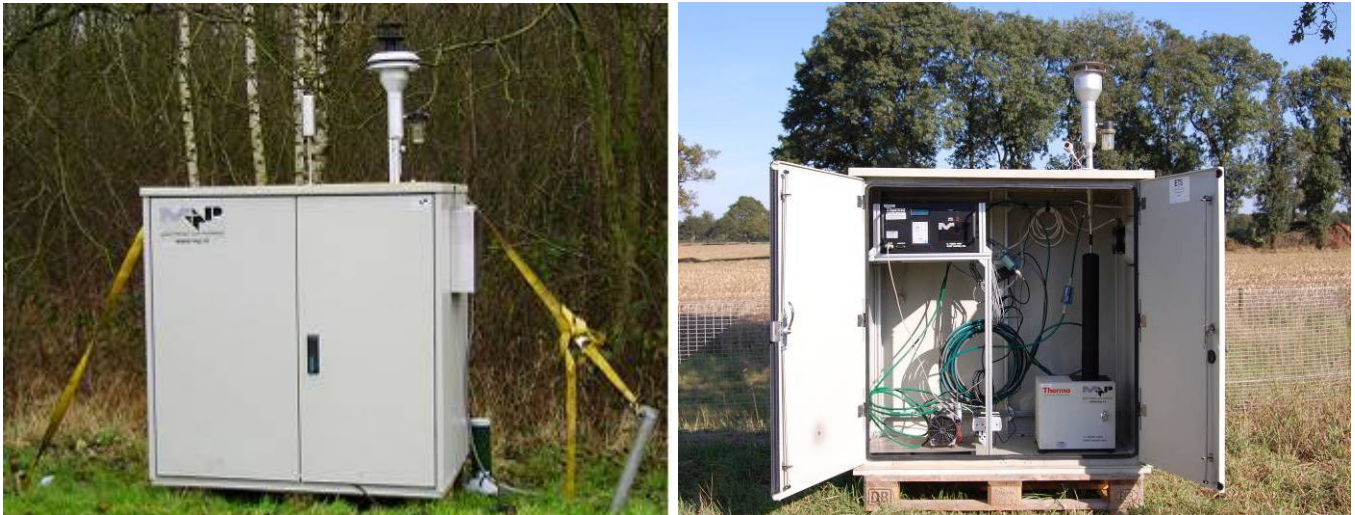
figuur 2 TEOM fijn stof meetapparatuur