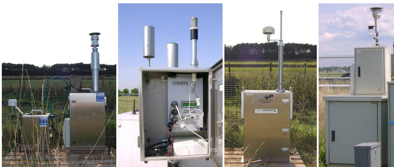
figuur 1 Fijn stof meetapparatuur, van links naar rechts LVS, Osiris, Grimm en TEOM-FDMS

Voor fijn stof (PM) beschikken we over verschillende meetinstrumenten, elk met eigen toepassingsgebied en eigenschappen met betrekking tot de nauwkeurigheid.